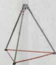
2,50 m con cinta